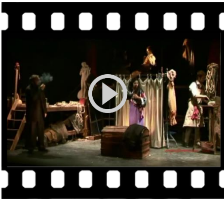
Diana e la Tuda (2013), Regia: Andrea Bizzarri Dall'Atto primo (durata 02:18 min.)

Clicca sul Frame per visualizzare la scena relativa.