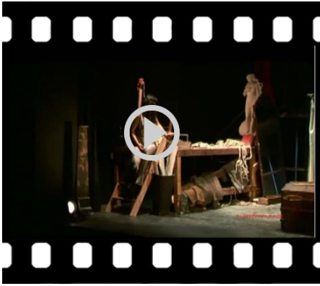
Diana e la Tuda (2013), Regia: Andrea Bizzarri Dall'Atto primo (durata 07:14 min.)

Ma Sirio ha come unico obiettivo quello di portare a compimento il proprio capolavoro. Per questo non si fa scrupoli di sorta e, sebbene sia fidanzato con Sara, decide seriamente di prendere in moglie Geltrude, la Tuda, ma per puro interesse estetico ed egoistico.