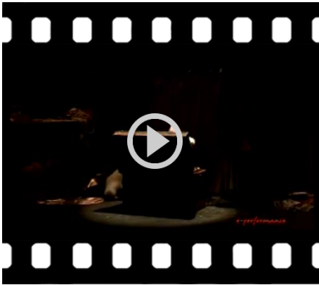
Diana e la Tuda (2013), Regia: Andrea Bizzarri Dall'Atto secondo (durata 02:16 min.)

La concitazione di questo momento e la passione sfrenata per l'abbigliamento celano in realtà il malessere provocato dal mancato affetto da parte del marito. Difatti, specchiandosi, la Tuda si riscoprirà consunta tanto nello spirito quanto nel fisico. E la stessa sorte sarà riservata alle statue che verranno rivestite di drappi, quasi per occultare la loro debolezza.