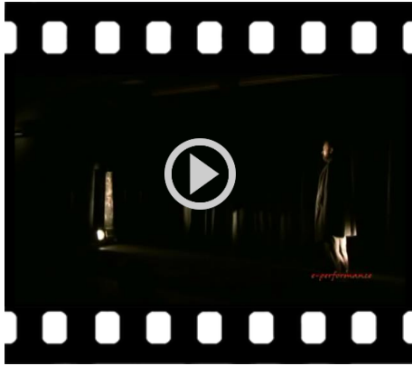
Diana e la Tuda (2013), Regia: Andrea Bizzarri Dall'Atto primo (durata 03:56 min.)

È giunto adesso il momento di conoscere da vicino la storia di Diana e la Tuda . Lo faremo mediante uno storytelling interattivo, un racconto in cui parole e video si susseguono e si integrano. Iniziamo dalla visione della prima scena.